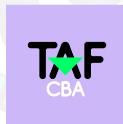
Trabajadorxs del Arte Feministas Córdoba (Argentina) http://tiny.cc/taf-cba-ARG