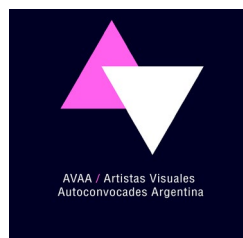
AVAA - Artistas Visuales Autoconvocades (Argentina) http://tiny.cc/avaa-Arg

Para el desarrollo de algunas categorías y Montos Mínimos Referenciales de este acuerdo, se realizó un proceso de diálogo y homologación con el Tarifario de Artes Visuales* realizado por las asociaciones de arte/artistas de Argentina: