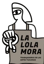
La Lola Mora Argentina (Argentina) https://lalolamora.org/